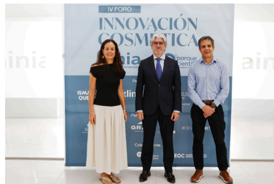
El IV Foro de Innovación Cosmética sitúa la